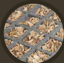
FONDATIIONS FERTILES OU MINÉRALES